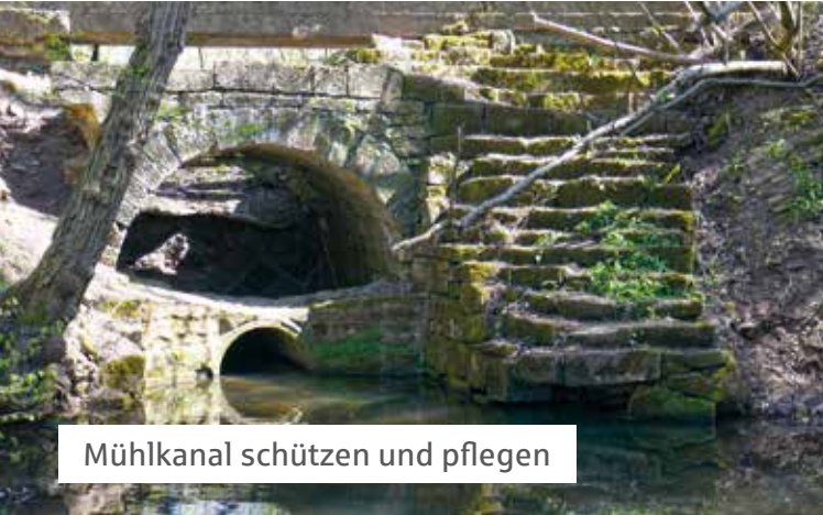
Mühlkanal schützen und pflegen