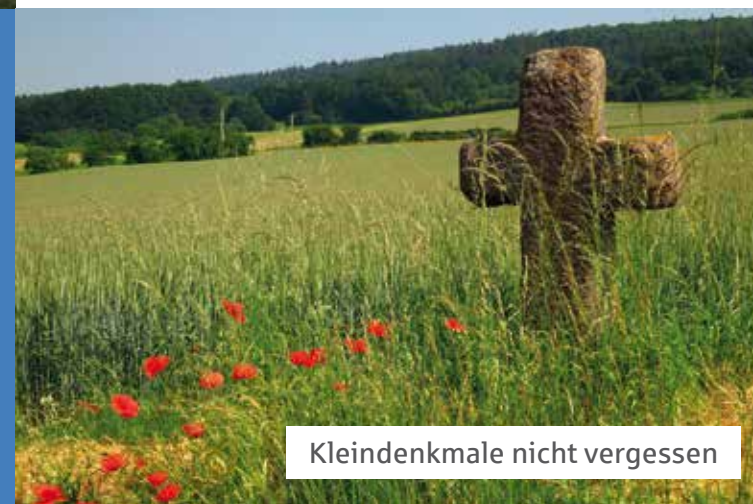
Kleindenkmale nicht vergessen

Angesprochen ist, wer sich um Kleindenkmale kümmert, wer sie schützt, renoviert und pflegt, wer eines vor dem Untergang rettet, wer sich ihrer Kulturge-