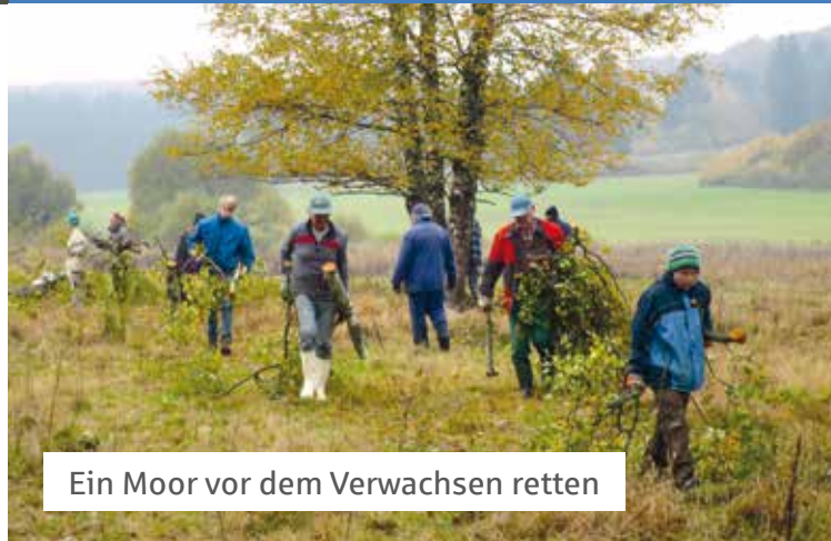
Ein Moor vor dem Verwachsen retten

Preiswürdig sind insbesondere auch solche Ansätze, mit denen Kulturlandschaften, die durch historische Nutzungsweisen entstanden sind, auch unter den geänderten Rahmenbedingungen moderner Landnutzung erhalten werden können.