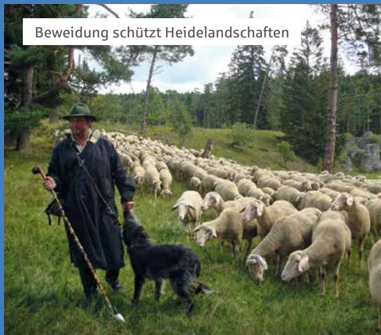
Beweidung schützt Heidelandschaften