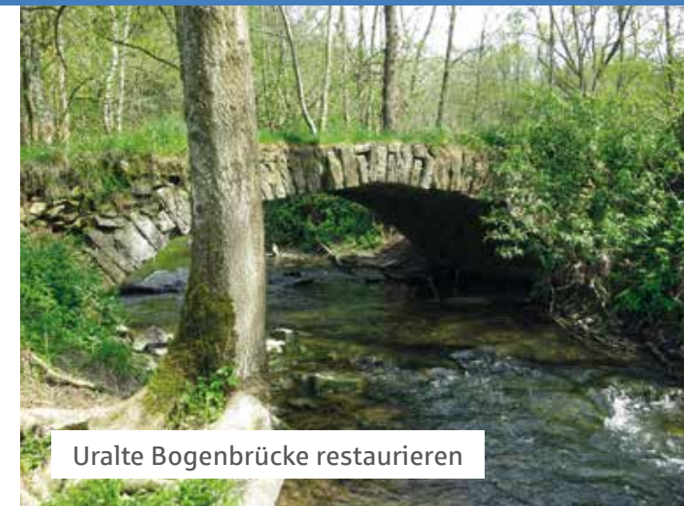
Uralte Bogenbrücke restaurieren

Die Teilnahme von Erwachsenen ist nicht ausgeschlossen, das beispielgebende Engagement der jungen Menschen muss aber im Vordergrund stehen.