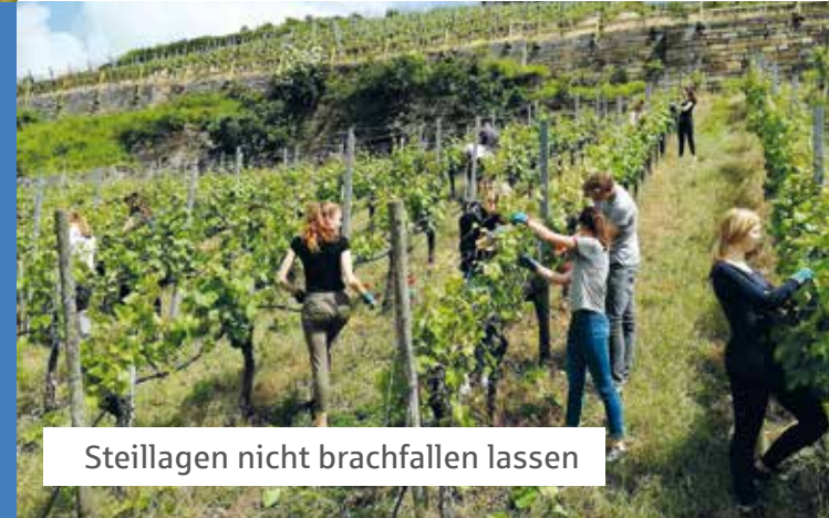
Steillagen nicht brachfallen lassen

Dies alles ist dokumentiert im Online-Archiv unter www.schwaebischer-heimatbund.de/klp-archiv