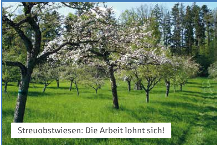
Streuobstwiesen: Die Arbeit lohnt sich!