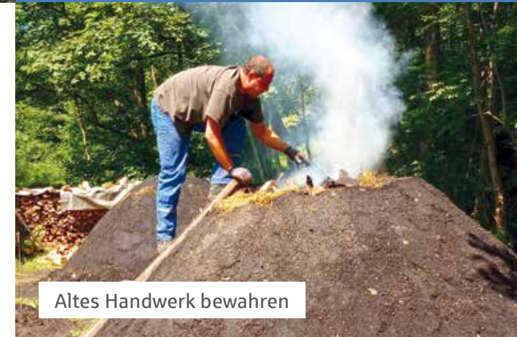
Altes Handwerk bewahren

Schwäbischer Heimatbund e.V. Weberstraße 2 | 70182 Stuttgart Tel. (0711) 23942-0 post@kulturlandschaftspreis.de www.kulturlandschaftspreis.de www.schwaebischer-heimatbund.de