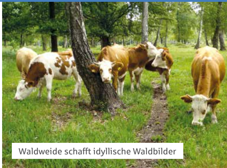
Waldweide schafft idyllische Waldbilder

Der unersetzliche Reichtum verschiedenartiger und zugleich unverwechselbarer Landschaftsbilder als ge-